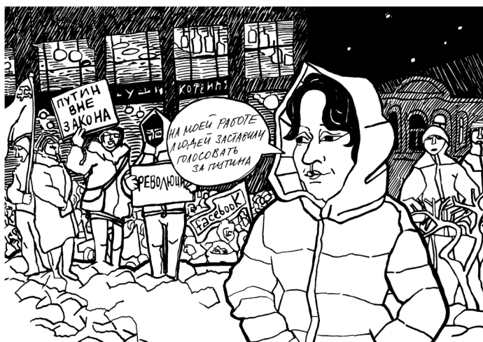
Рис. 3. Митинг на Пушкинской площади. Москва, 5.03.2012.