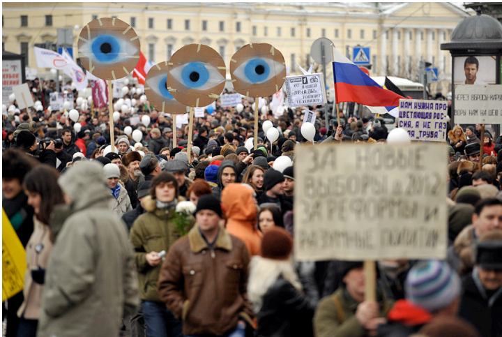
Рис. 4. Шествие по Лиговскому проспекту. Санкт-Петербург, 25.02.2012.