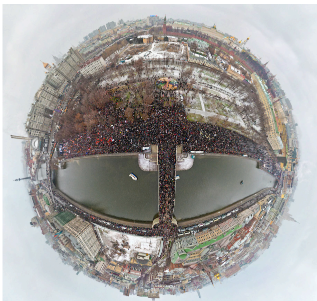
Рис. 1. Митинг на Болотной площади. Москва, 10.12.2011.